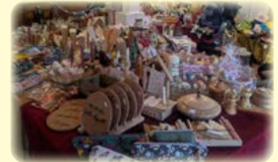
Weihnachts- & Geschenkausstellung