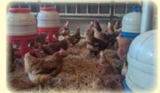
Einblick in den Hühnerstall.

gelände der Firma Sommer, im kleinen „Eierhäuschen“ zu kaufen.