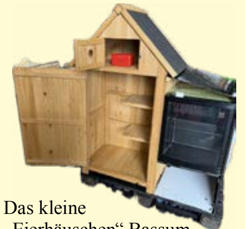
Das kleine „Eierhäuschen“ Bassum.