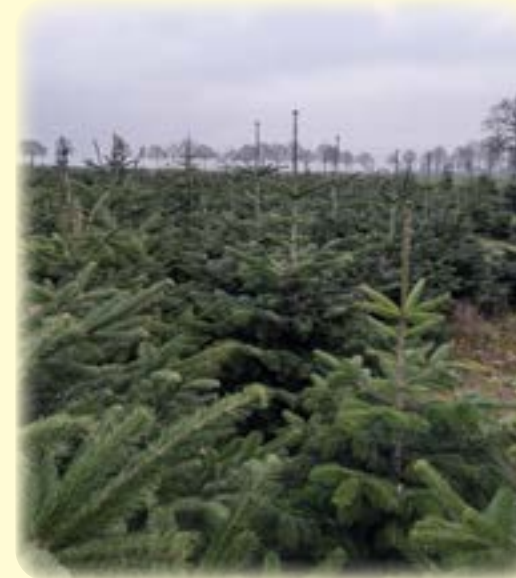
Glücklich wachsende Nordmantannen