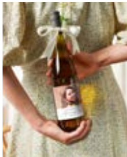
Geldgeschenk mit Überraschungsmoment

Zu etwas ganz Besonderem wird sie durch ein Foto-Etikett mit einer liebevollen Botschaft: „Für die beste Freundin – und bald die beste Trauzeugin?“