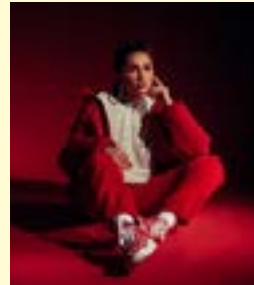
AYLO - Die Rapperin Aylo aus Berlin

Ihre Deep House- und Rap-Songs, voll mit Straßen-Attitüden und Melancholie, werden seither in der Hip-Hop Szene hart gefeiert. In ihrem Album „Therapie“ (2024) geht es um mentale Gesundheit und sie zeigt ehrlich, was sie bewegt.