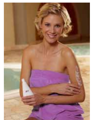
Zupfmassagen mit einer vitaminhaltigen Körperlotion helfen, die Haut zu straffen.

nationen mit Urea und pflanzlichen Ölen bringen die hyperaktive Haut wieder ins Gleichgewicht.