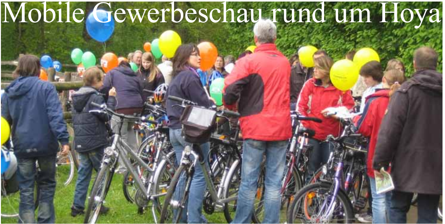
Markenzeichen der Teilnehmer bei "Grafschaft Hoya mobil": die Luftballons

Hoya. Am Himmelfahrtstag (17. Mai) findet zum 14. Mal die mobile Gewerbeschau „Fahrradrallye - Grafschaft Hoya ist mobil“ statt. Die diesjährige Route führt laut der Homepage durch den Südwesten der Samtgemeinde.