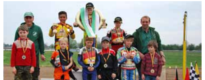
Siegerfoto der Junioren-A.

Bereits zur Mittagsstunde schickten die Veranstalter die Junioren auf die Bahn. Im Innenfeld entstand in den vergangenen Wochen eine 280 Meter lange Sandbahn. In den beiden Juniorenklassen gingen 28 Fahrer an das Startband.