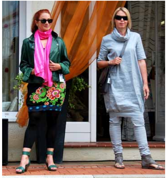
Am Engelbergplatz finder wieder die Modenpräsentation statt.

Bruchhausen-Vilsen. Am 20. Mai wird aus dem Ortskern von Bruchhausen-Vilsen wieder eine Meile aus Gewerbeschau, Kunsthandwerker- und Flohmarkt. Dazu haben die Geschäfte geöffnet. Das Maifestival beginnt um 13 Uhr und die Geschäfte schließen um 18 Uhr. Nach dem Erfolg vom vergangenen Jahr wird die Modepräsentation auf dem Engelbergplatz wieder stattfinden. Organisiert hat die Fördergemeinschaft Bruchhausen-Vilsen das Event.