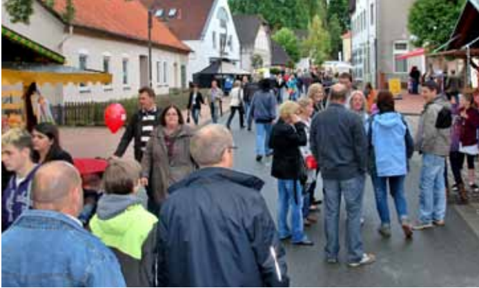
Auf volle Gassen hoffen die Veranstalter auch in diesem Jahr.

tik-Uhren-Schmuck Leers sorgen für die richtigen Accessoires. Die Models schreiten die Stufen herunter und tauchen in die Menschenmengen ein. So sind die Besucher mittendrin.