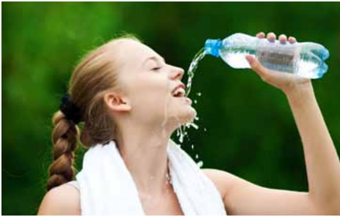
Trinken ist beim Sport das A und O - doch Mineralwasser allein reicht häufig nicht aus.