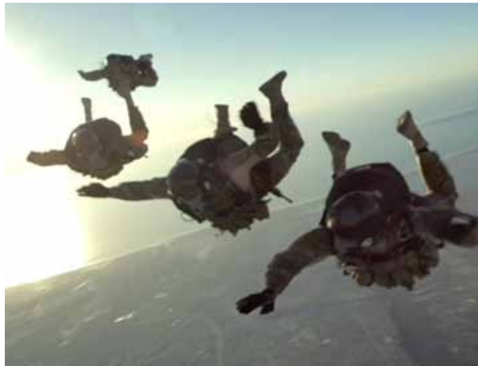
Absprung mit dem Fallschirm ins Ungewisse.

Rorkes Truppe erhält den Marschbefehl: Die Männer sollen Morales befreien und sicherstellen, was sie über Christos Aktivitäten in Erfahrung gebracht hat. Aus mehr als 6000 Metern Höhe springen die U.S. Navy Seals mit ihren Fallschirmen ab und landen im nächtlichen