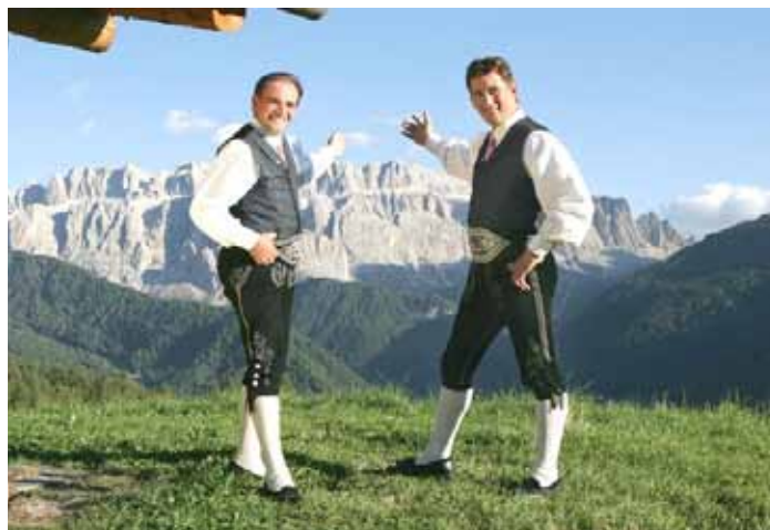
Die Ladin-er vor den Alpen.